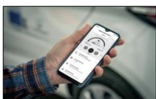
My Renault appen