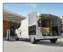
Generös lastvolym (6,7 m 3 ) och lastlängd med genomlastningslucka (4150mm) Möjlighet att få full tillgång med skjutdörr på vänster sida