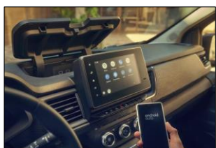
EasyLink 8" med smartphonespeglning