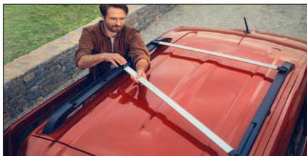
Smarta takräcken. Förvandla lätt från längsgående till tvärgående