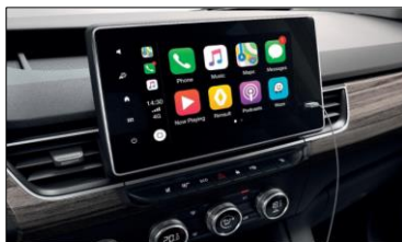
Easy link 8" med Apple Carplay eller Android Auto