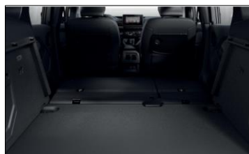
Fäll baksätet för mer lastyta (ca 2300L)