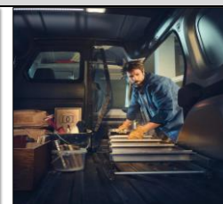
Lasta långa föremål från sidan!

3-års nybilsgaranti/100 000km (läs mer på www.renault.se ).