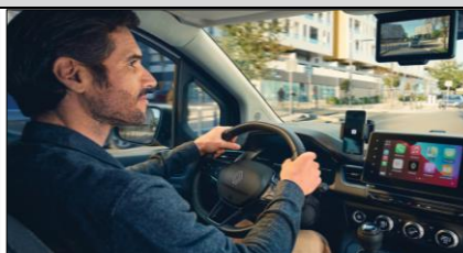
Förarmiljön med digital backspegel