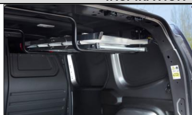
Med Easy Inside Rack får du undan långa föremål från golvet med genomlastningsluckan ovanför passageraren