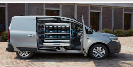
Smart hyllösning från Sortimo tillsammans med Open Sesame!