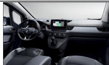
Exempel på förarmiljö med tillval