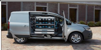
Smart hyllöning från Sortimo tillsammans med Open Sesame!