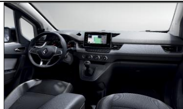
Förarmiljön på en Nordic Line med klimatanläggning