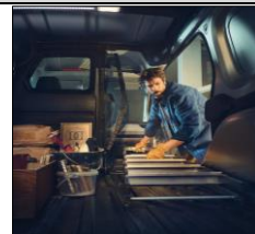
Lasta långa föremål från sidan!

3-års nybilgaranti/100 000km (läs mer på www.renault.se ).