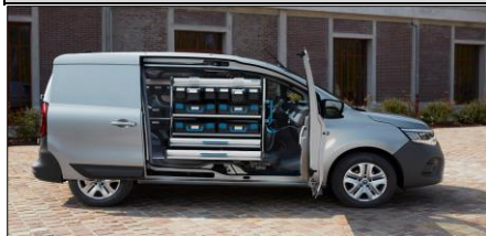
Smart hyllösning från Sortimo tillsammans med Open Sesame!