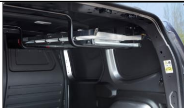
Med Easy Inside Rack för du undan långa föremål från golvet med genomlastningslyckan ovanför passageraren