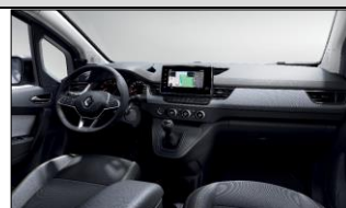
Förarmiljön på en Nordic Line med klimatanläggning