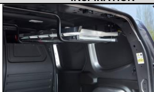
Med Easy Inside Rack får du undan långa föremål från golvet med genomlastningslyckan ovanför passageraren