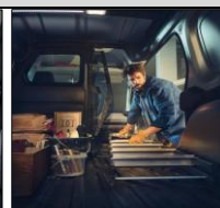
Lasta långa föremål från sidan!

3-års nybilsgaranti/100 000km (läs mer på www.renault.se ).