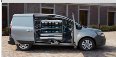
Smart hyllösning från Sortimo tillsammans med Open Sesame!