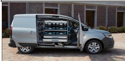
Smart hyllösning från Sortimo tillsammans med Open Sesame!