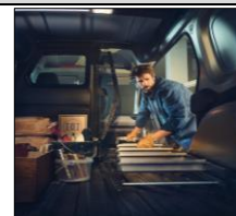
Lasta långa föremål från sidan!

3-års nybilsgaranti/100 000km (läs mer på www.renault.se ). Samtliga priser är rekommenderade cirka priser exkl. moms. Vi förbehåller oss rätten att när som helst ändra priser och specifikationer utan förvarning. Renault reserverar sig för ändringar och eventuella felskrivningar.