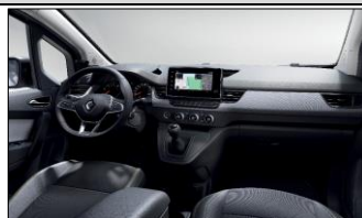
Förarmiljön på en Nordic Line med klimatanläggning