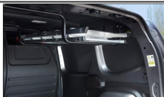
Med Easy Inside Rack får du undan långa föremål från golvet med genomlastningslyckan ovanför passageraren