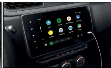
Easy Link 8" display med smartphone-speglning