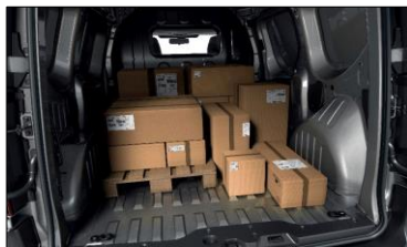
3,3m 3 med 1,91m lastlängd