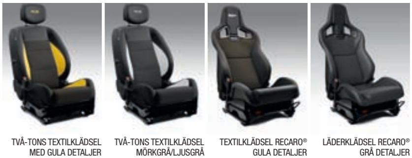
TVÅ-TONS TEXTILKLÄDSEL MED GULA DETALJER TVÅ-TONS TEXTILKLÄDSEL MÖRKGRÅ/LJUSGRÅ TEXTILKLÄDSEL RECARO® GULA DETALJER LÄDERKLÄDSEL RECARO® GRÅ DETALJER