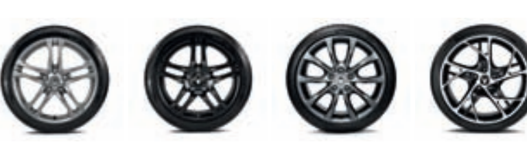
ALUMINIUMFÄLG 18" AX-L ALUMINIUMFÄLG 18" AX-L MATTSVART ALUMINIUMFÄLG 18" KEZA ALUMINIUMFÄLG 19" STEEV