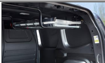
Med Easy Inside Rack får du undan långa föremål från golvet med genomlastningslyckan ovanför passageraren