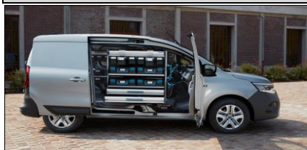
Smart hyllösning från Sortimo tillsammans med Open Sesame!